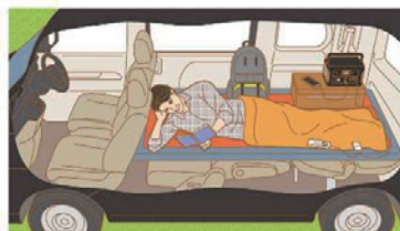
車中泊に（電気毛布など）