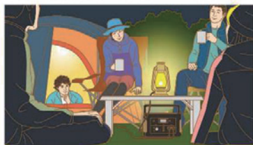
キャンプなどに（LEDランタンなど）