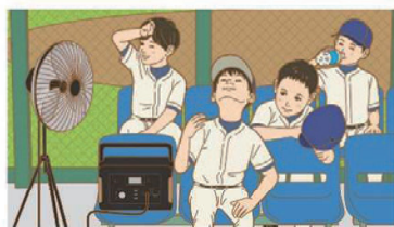
屋外イベントに（扇風機など）