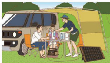
季節ごとの行楽に（小型冷蔵庫など）