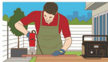
DIYに（電動ドリルなど）